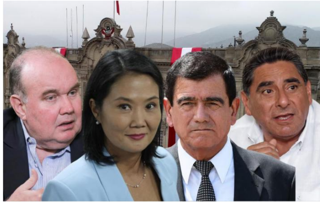
José Williams de Avanza País sube algunos peldaños en la intención de voto y Mario Vizcarra cae del 4% al 2%.

Keiko Fujimori de Fuerza Popular se mantiene en el segundo lugar, pero sube de un 8% a 9% respecto de la quincena anterior.