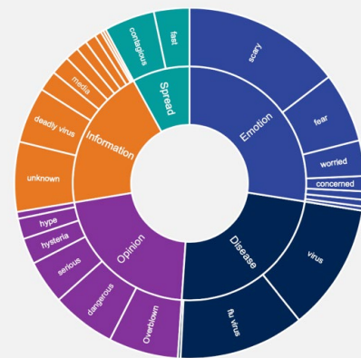
WHAT WORDS DO YOU ASSOCIATE WITH THE CORONAVIRUS (COVID-19)? Based on AI text analytics processing: (n=824)

Note: Themes are not mutually exclusive as the respondents can express more than one theme. Counts are reproporioned to illustrate relative share