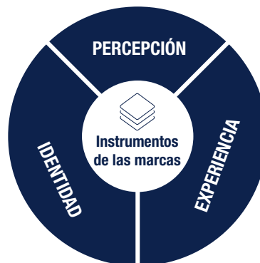
Gráfico 3 Instrumentos de las marcas

Cuando una marca ofrece en el momento oportuno un equilibrio único entre elementos funcionales y emocionales, reforzado con activos multisensoriales complementarios, dicha marca viene a la mente más fácilmente en los momentos clave.