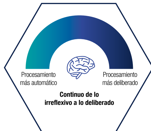
Gráfico 1 El continuo de lo irreflexivo a lo deliberado

« Nuestras decisiones surgen dentro de un continuo en el que operan simultáneamente diversos procesos cognitivos que cubren un espectro que va de lo deliberado a lo irreflexivo ».