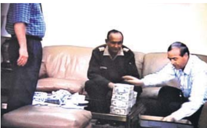
VLADIVIDEOS. La 'salita' del Servicio de Inteligencia Nacional: escenario de la mayor corrupción que se recuerda en el país.

Durante el primer siglo de El Comercio y hasta bien avanzado el siglo XX, los periodistas debían recorrer plazas y mercados y asistir a las manifestaciones políticas y sociales para intentar captar el sentir de la opinión pública. Con el tiempo fue evidente que estas observaciones recogían solo la expresión del sector más activo de la ciudadanía. Se sabía que había una mayoría silenciosa cuyo parecer debía también ser tomado en cuenta por las autoridades y la prensa, pero no había como averiguarlo. Hasta que en los años 80 llegaron las encuestas. Ipsos Perú (entonces como Apoyo) acompaña a El Comercio en su rol de historiador del presente desde 1984. Los archivos de Ipsos y El Comercio guardan las cifras de la cambiante opinión pública nacional frente a